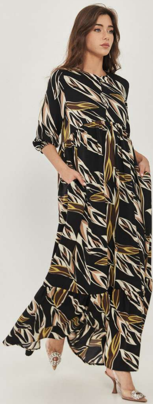
שמלת קומה באורך מקסי - עלים שחור