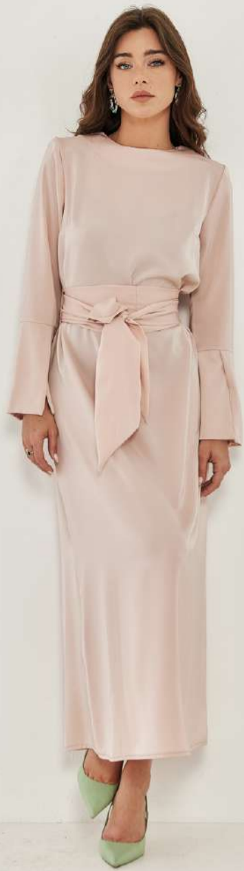
שמלת מקסי עם חגורה – ורוד