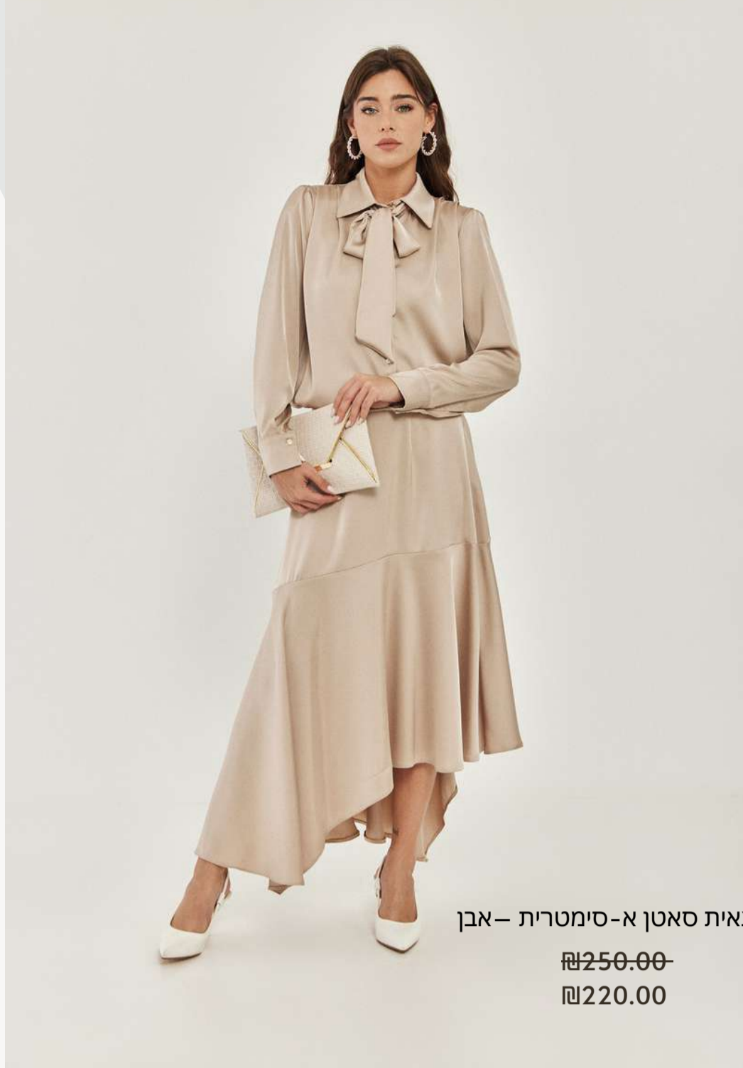
חצאית סאטן א-סימטרית – אבן