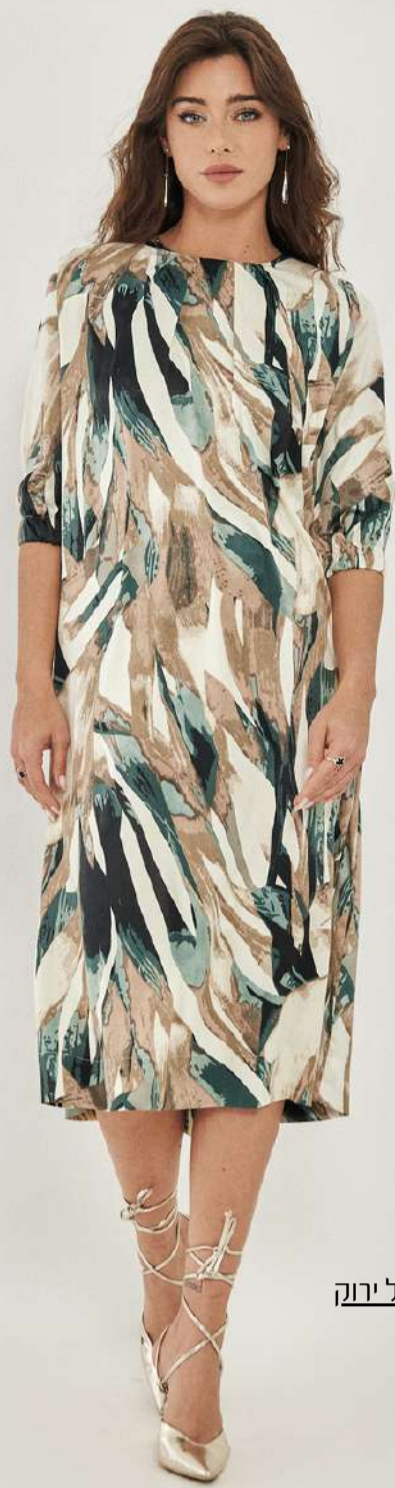
שמלת בגזרת A - סאטן גלים כחול ירוק