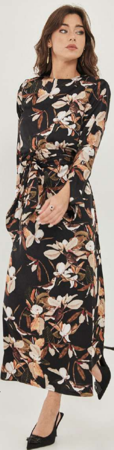
שמלת מקסי עם חגורה – שחור פרחים