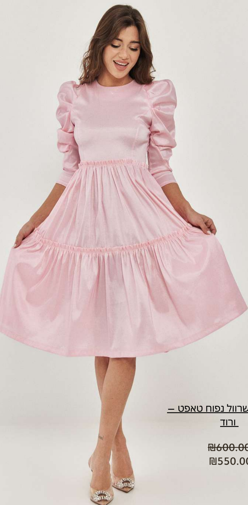
שמלה עם שרוול נפוח טאפט – ורוד