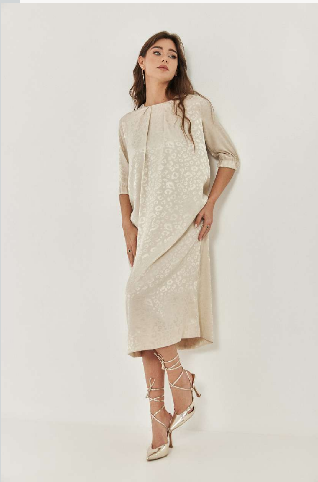
שמלת בגורת A - סאטן ג'קארד שמנת