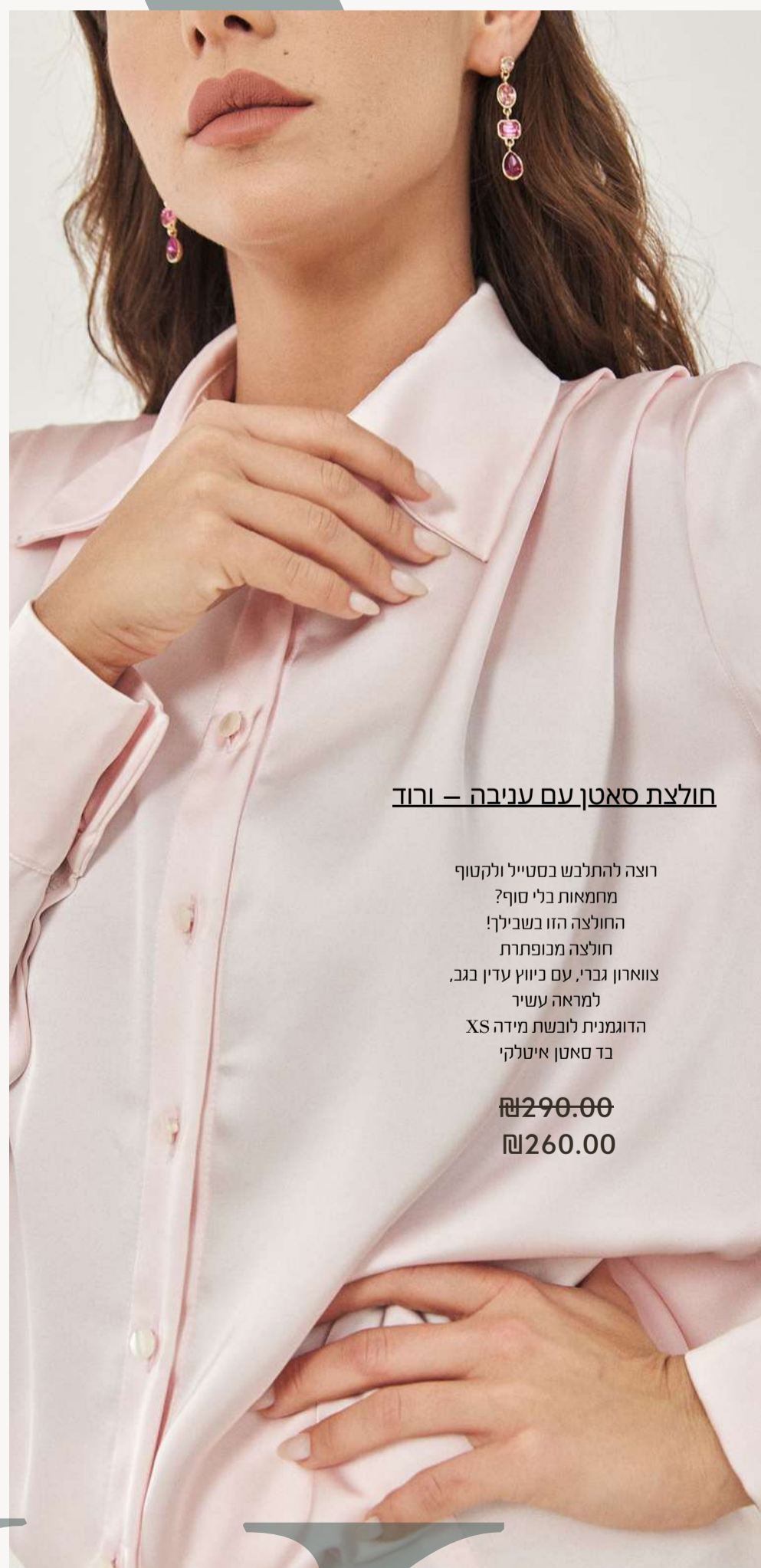
חולצת סאטן עם עניבה – ורוד

רוצה להתלבש בסטייל ולקטוף מחמאות בלי סוף? החולצה הזו בשבילך! חולצה מנופפתת צווארון גברי, עם כיווץ עדין בגב, למראה עשיר הדוגמנית לובשת מידה XS בד סאטן איטלקי