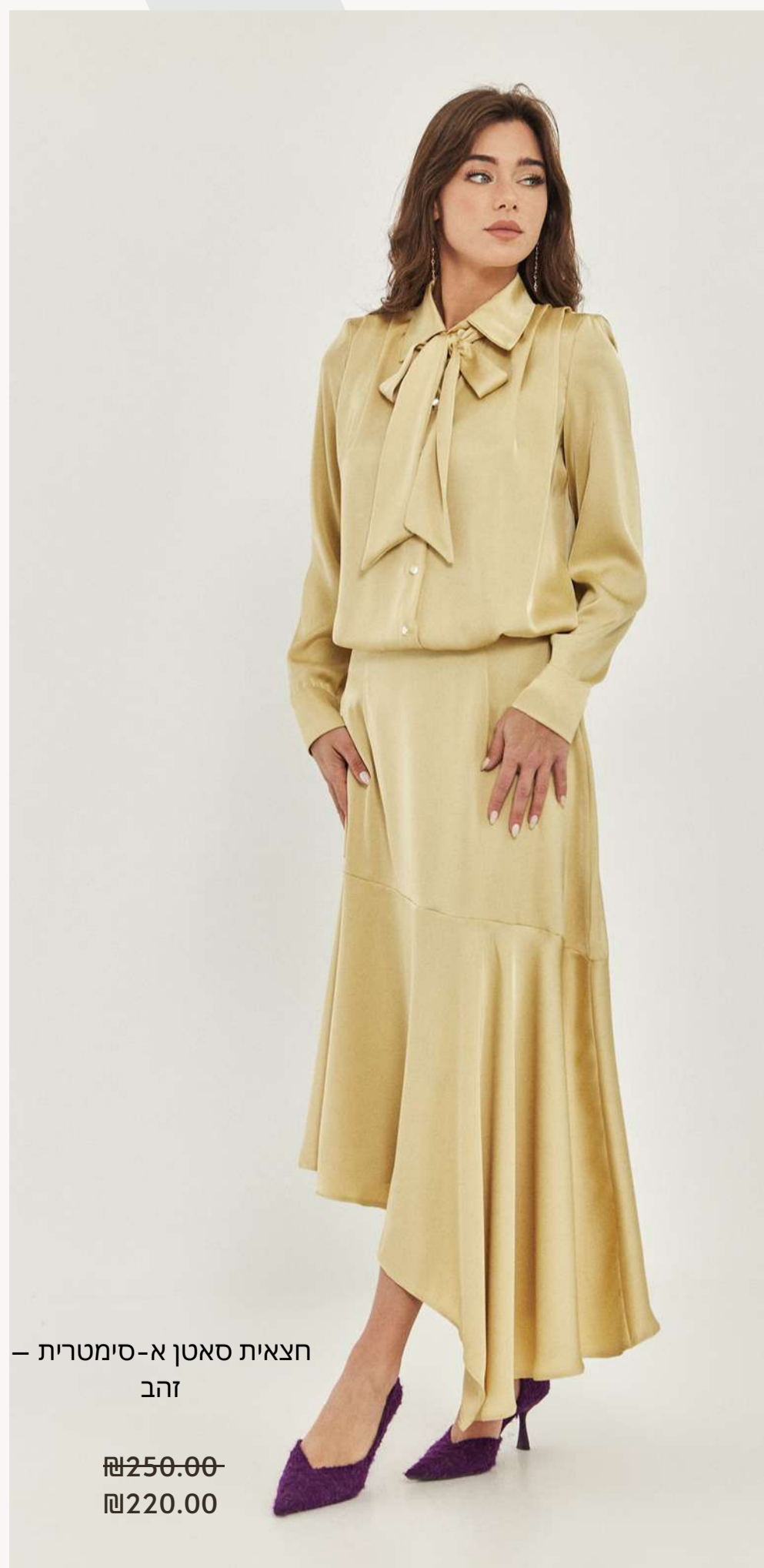
חצאית סאטן א-סימטרית – זהב