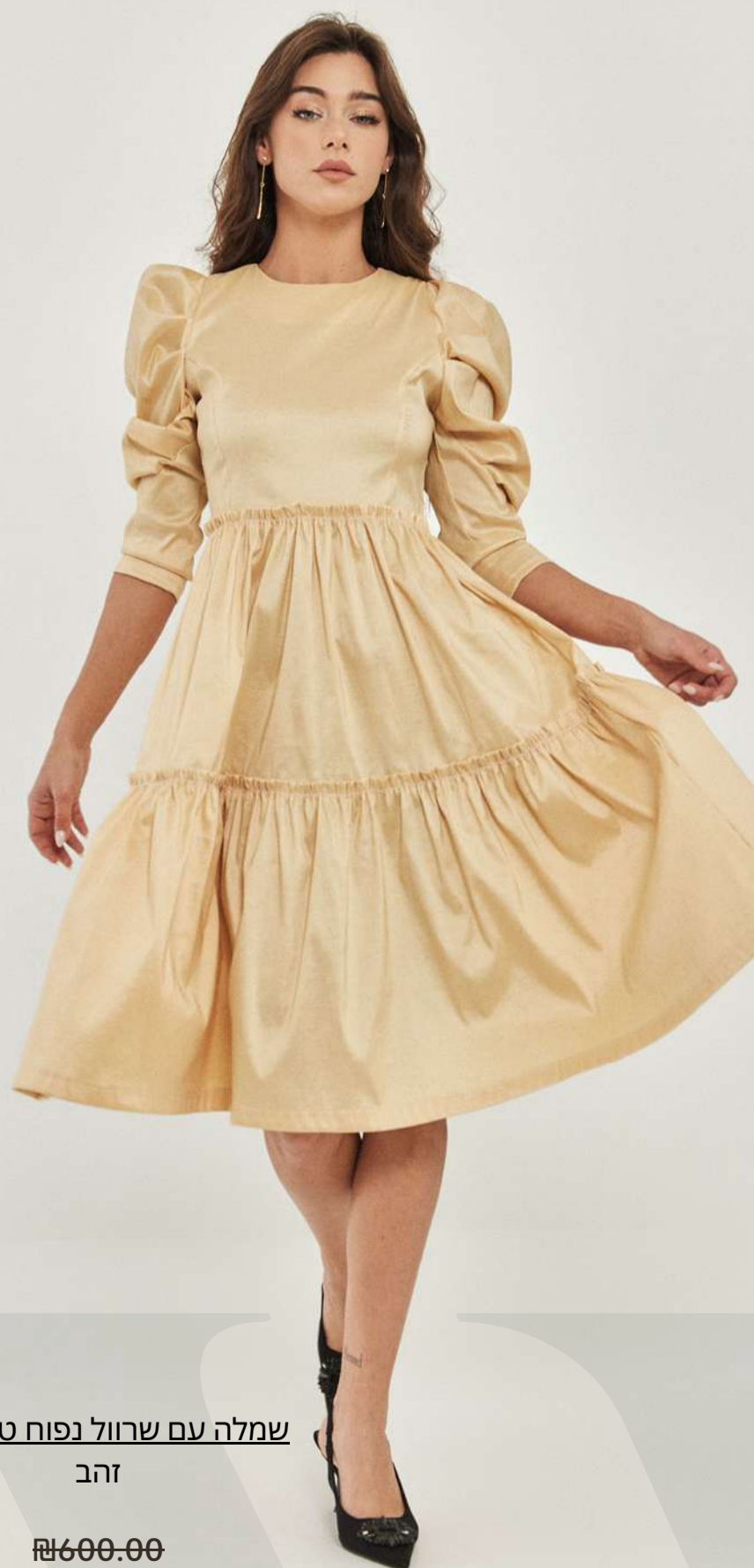
שמלה עם שרוול נפוח טאפט – זהב