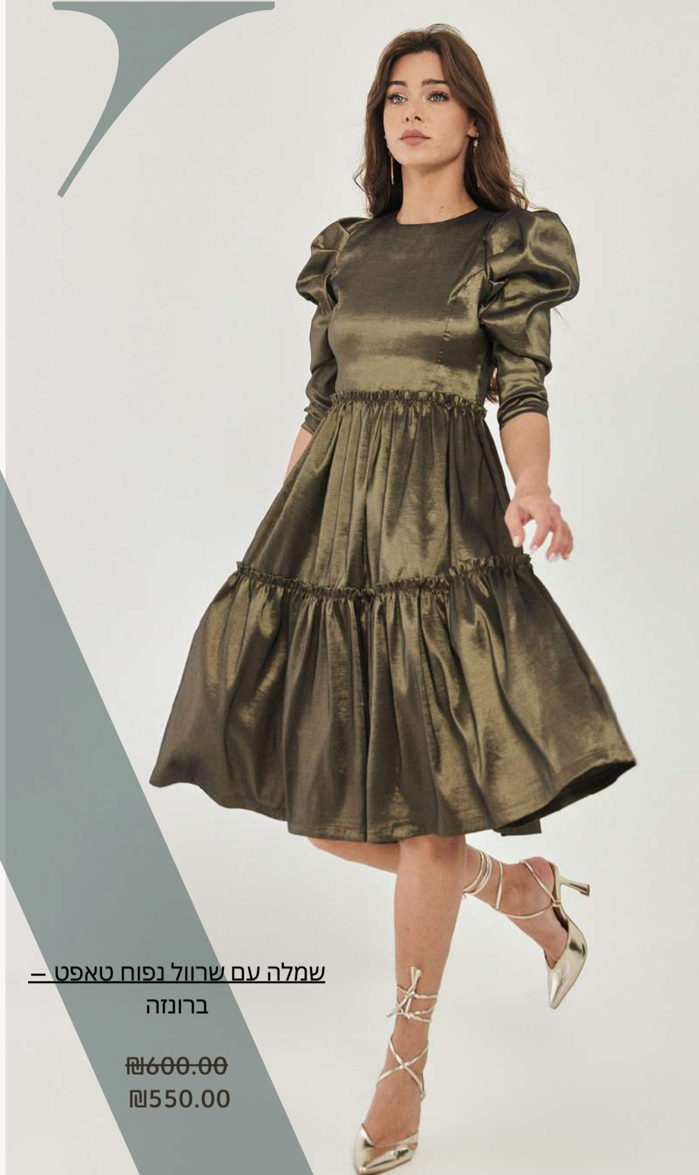
שמלה עם שרוול נפוח טאפט – ברונזה