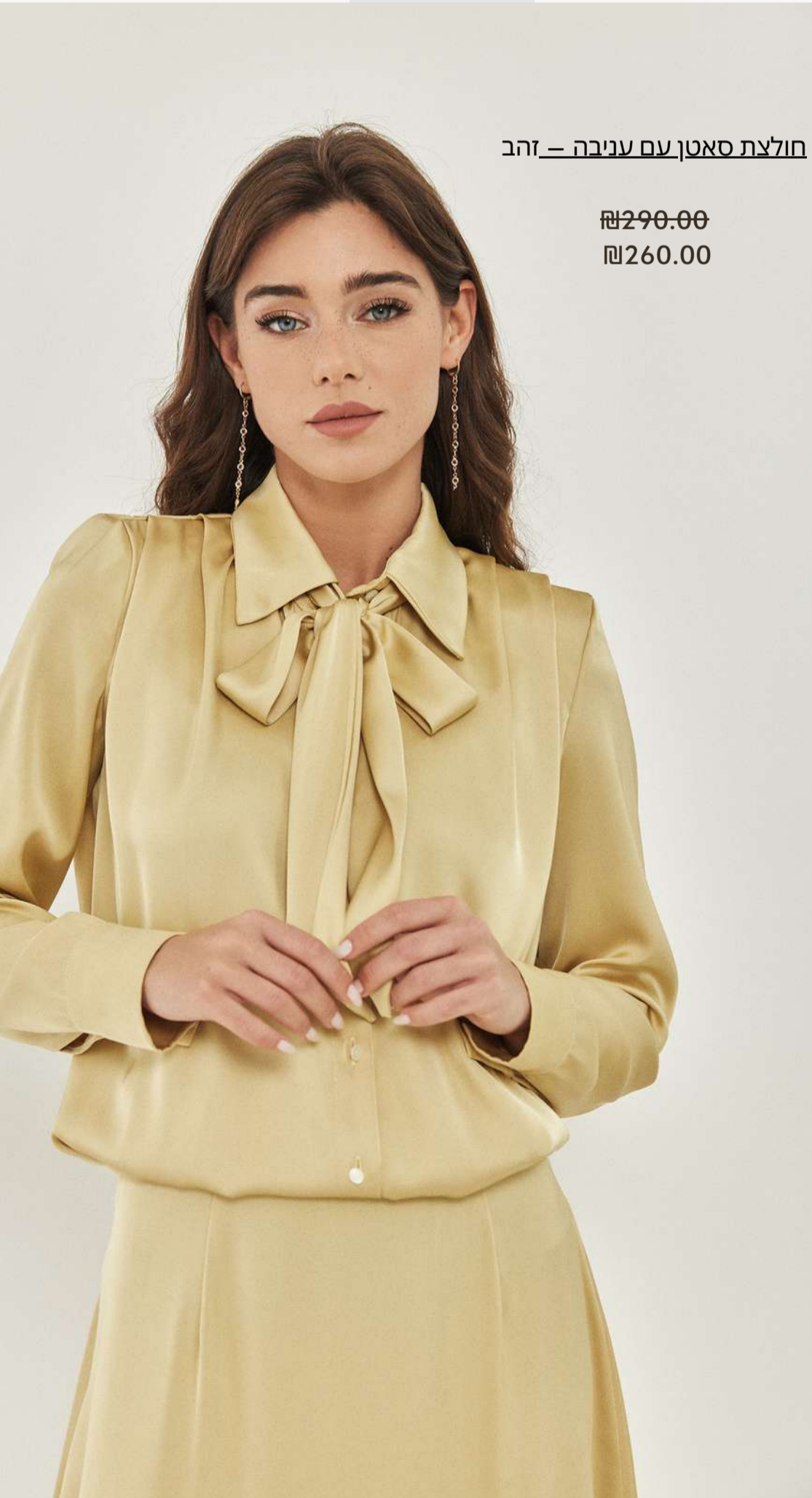
חולצת סאטן עם עניבה – זהב