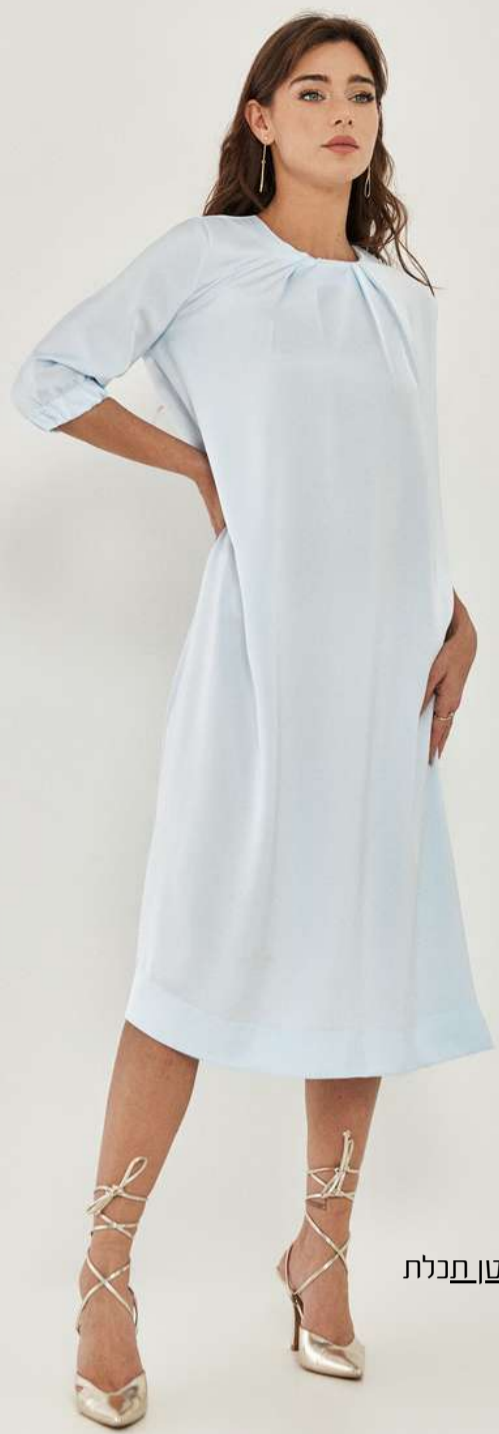
שמלת בגורת A - סאטן תכלת