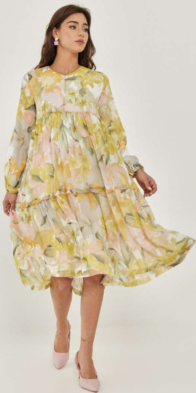
שמלת אברסייז – שיפון פרח צהוב