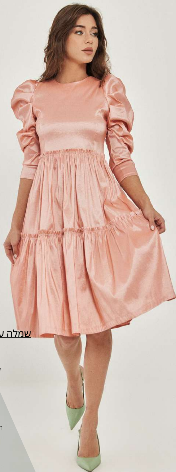
שמלה עם שרוול נפוח טאפט – אפרסק

שמלה מבד טאפט יוקרתי בגורה מלכותית שרוול נפוח מיוחד חתך מותן גבוה מטשטשת בטן וירכיים הדוגמנית לובשת מידה XS גובה הדוגמנית 1.70