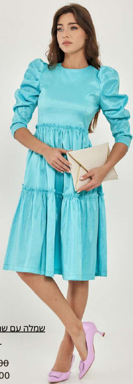
שמלה עם שרוול נפוח טאפט – תכלת