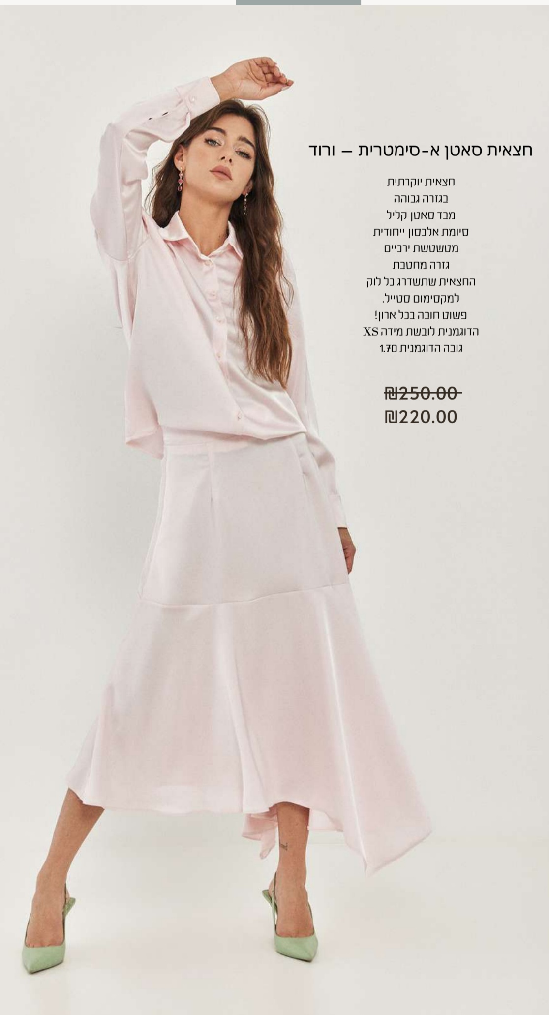
חצאית סאטן א-סימטרית – ורוד

חצאית יוקרתית בגורה גבוהה מבד סאטן קליל סימט אלכסון ייחודית מטשטשת ירכיים גזרה מחטבת החצאית שתשרג כל לוק למקסימום סטייל. פשוט חובה בכל ארון! הדוגמנית לובשת מידה XS גובה הדוגמנית 1.70