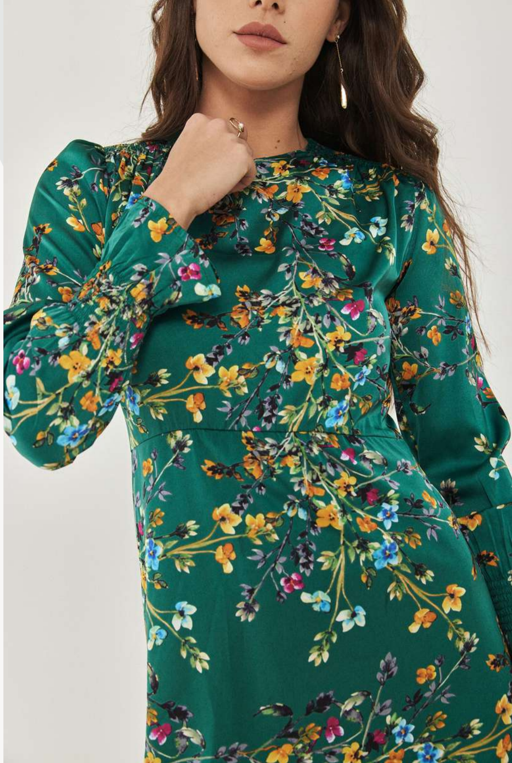
שמלת וולאן - פרינט פרחים ירוק