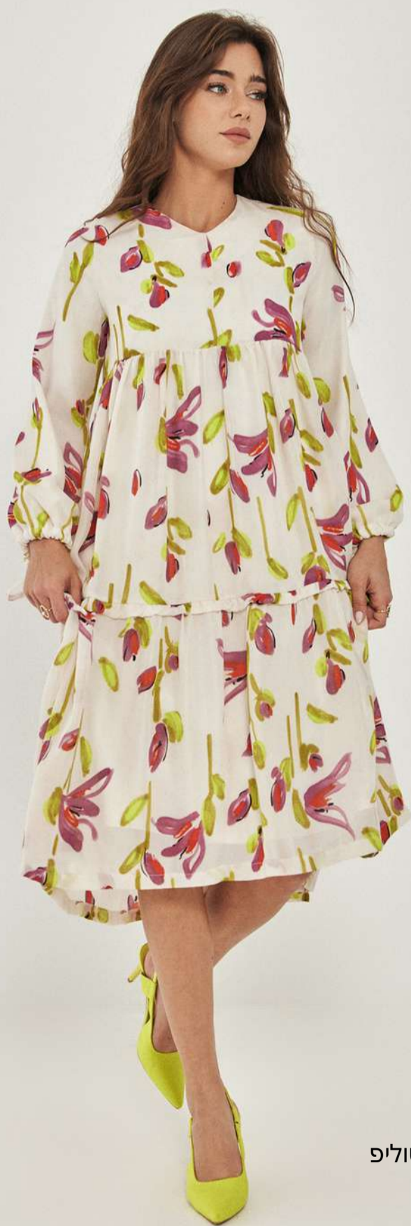
שמלת אברסייז – שיפון טוליפ