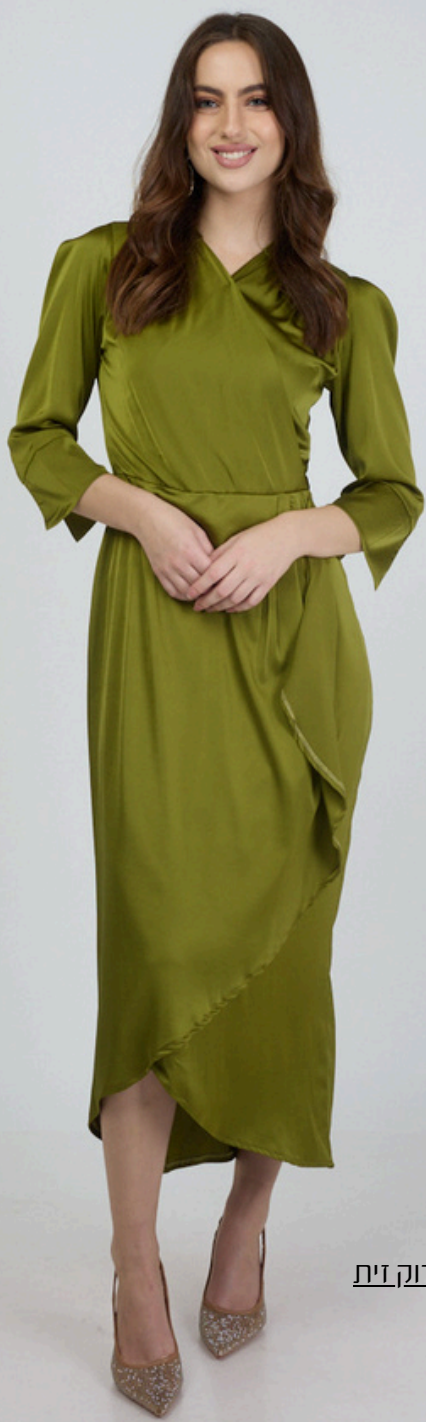
שמלת מעטפת סאטון - ירוק זית