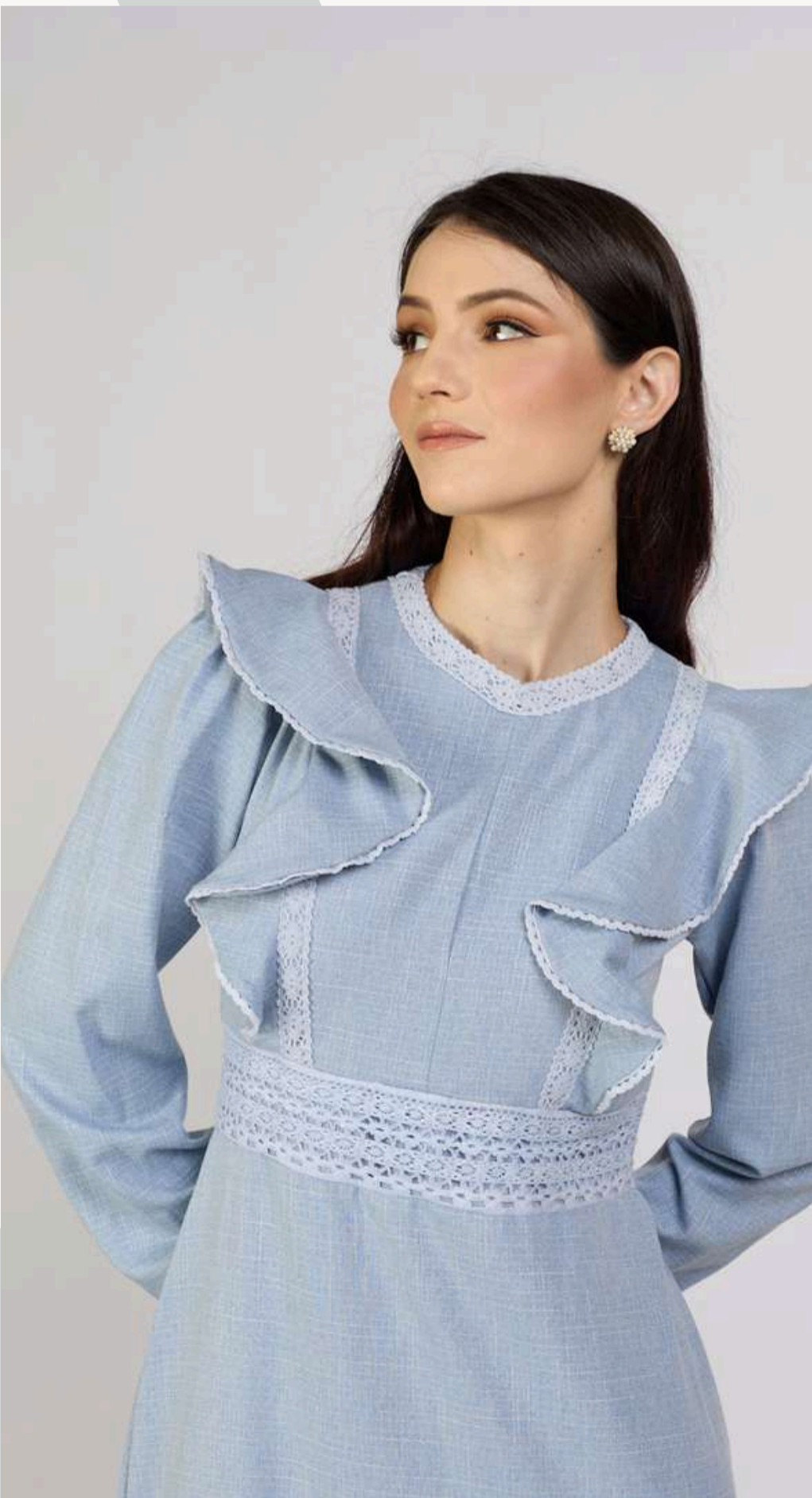
שמלת תחרה קומות - תכלת

שמלה ייחודית בגורה משגעת שלא תראי בשום מקום כצבעים מלכותיים גורה מחמיאה מדגישה מותן מכד יוקרתי במראה פשתני סרט תחרה עדין מקשט את השמלה ברכות ונותן מראה אצילי ועדין