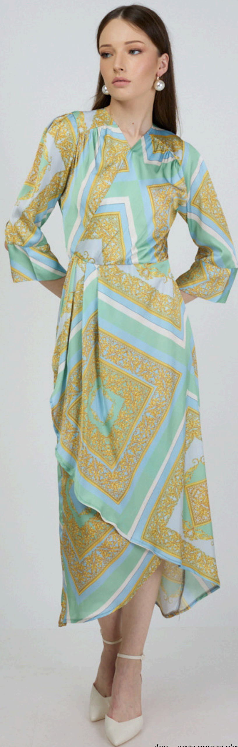
שמלת מעטפת סאטן - גוצ'ו