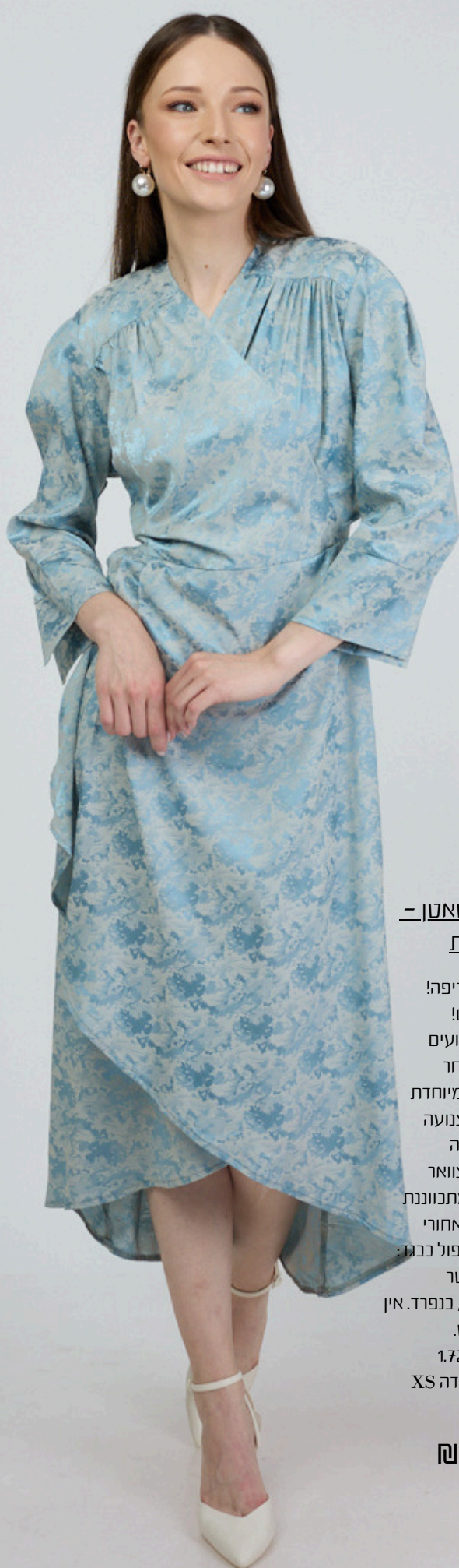
שמלת מעטפת סאטן - וינטג' תכלת

שמלה בגזרה מטריפה! וצבעים נדירים! מתאימה גם לאירועים מבד סאטן מובחר סיימת א-סימטרית מיוחדת דוגמאת מעטפת צנועה תפורה מקדיימה תיק תק בפתח הצוואר עם אופציה לסגירה מתכווננת פתיחה עם רוכסן אחורי הרכב בד והוראות הטיפול בבגד: 100% פוליאסטר כביסה עדינה 30 מעלות, בנפרד. אין לייבש במייבש. גובה הדוגמנית 1.72 הדוגמנית לובשת מידה XS