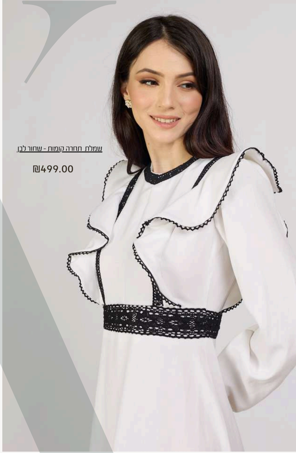
שמלת תחרה קומות - שחור לבן