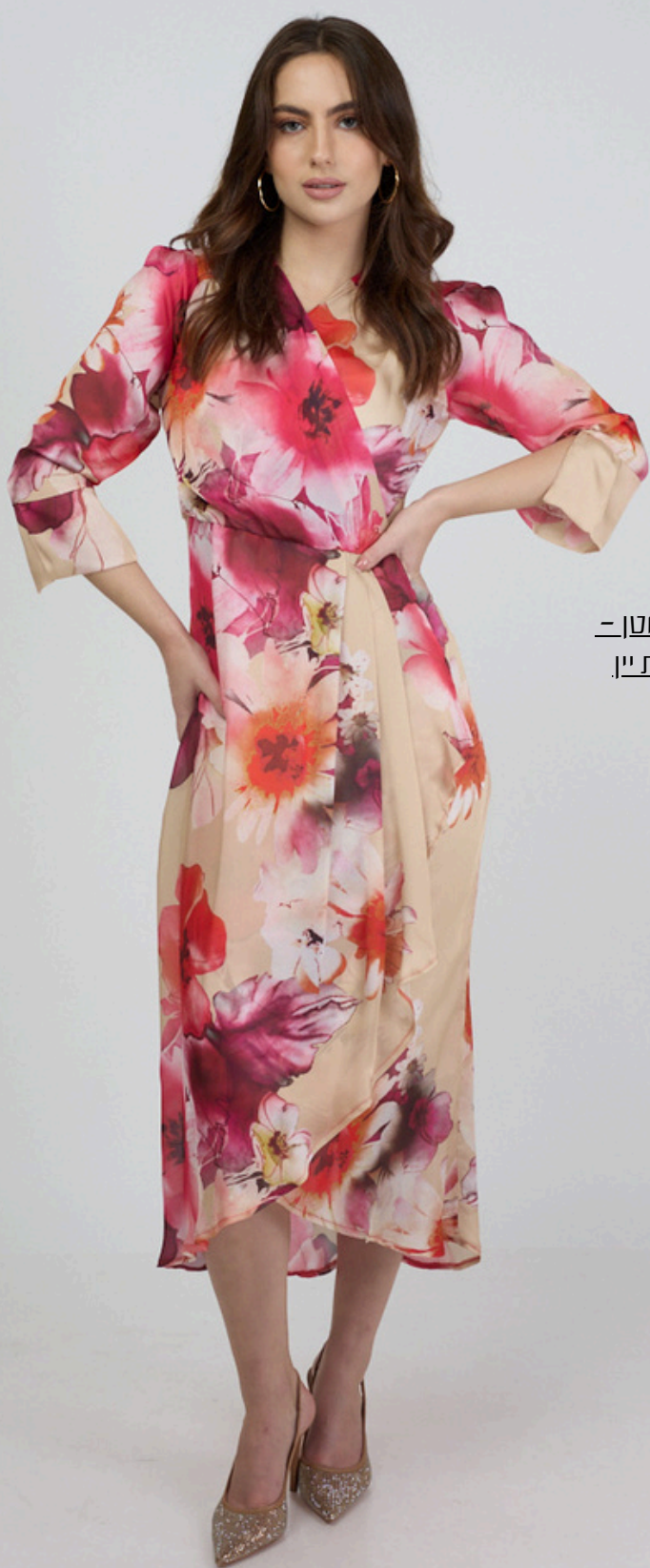
שמלת מעטפת סאטון - פרחים ורוד שמנת יין