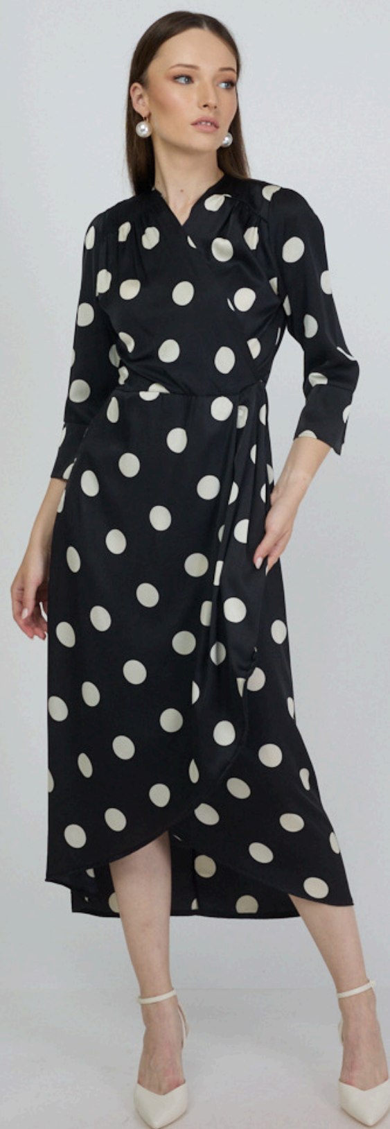
שמלת מעטפת סאטון - עיגולים שחור לבן