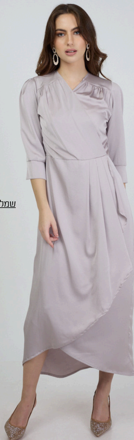
שמלת מעטפת סאטון - סגול בהיר